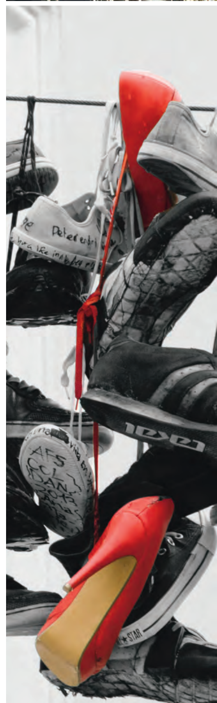
Foto: Når unge mennesker forlader Flensborg for f.eks. at tage en uddannelse andetsteds, skal de aflevere en (1) sko, der hænges op over Norderstrasse, hvor Dansk Centralbibliotek ligger. På den måde signaleres, at de unge nok kommer tilbage for at hente skoen – og så måske bliver i byen!